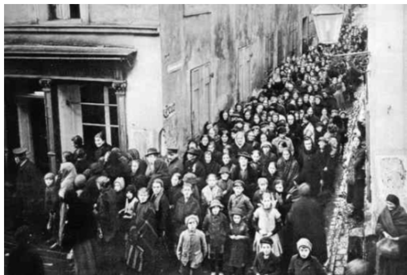
Anstehen nach Lebensmittel um 1917