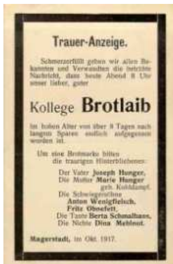
Postkarte um 1917

„... Trotz des Krieges hielten sämtliche Vereine ihre Generalkommunionen, sowie regelmäßig die Versammlungen mit zeitgemäßen Vorträgen ab und blieben auch in ständigem Verkehr mit den zum Heere einberufenen Mitgliedern. Von 638 Mitgliedern sind 338 zum Heeresdienst eingezogen, 19 bereits gefallen, 20 kriegsbeschädigt. Für Liebesgaben, Familienbeihilfen und Kriegsliteratur wurden 2.274,-- Mk. verausgabt.“